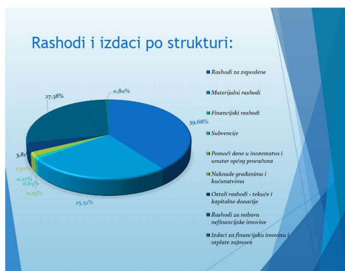
Slika br. 2. Rashodi i izdaci proračuna za 2021.g.

Sve potrebe Grada financiraju se iz proračuna, kojim su definirani svi prihodi i primici, rashodi i izdaci, njihova namjena i dinamika, a donosi ga Gradsko vijeće. Za izvršenje godišnjeg proračuna odgovorni su gradonačelnik i Upravna tijela. Svrha je proračuna odrediti jasan, logičan, ciljno usmjeren i na strateškim odrednicama usmjeren program rada, koji je polazište za alokaciju resursa Grada. Proračun je svojevrsni vodič za upravljanje Gradom, jer predstavlja tekuću razradu strateških dokumenata i njihov financijski izraz.